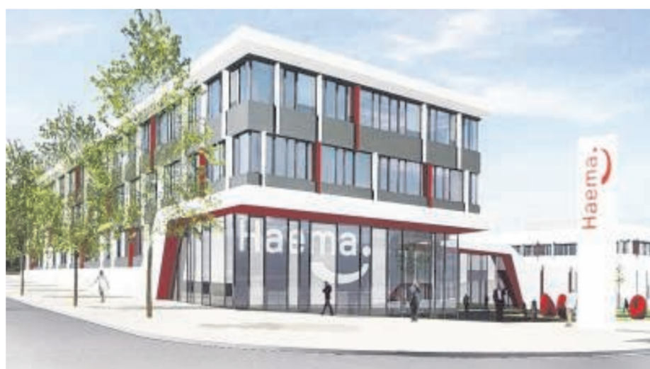
Der Verwaltungsbau an der Zwickauer Straße wird repräsentativer ausfallen als die dahinter liegenden vier Gebäude für Produktion, Technik und Lager.