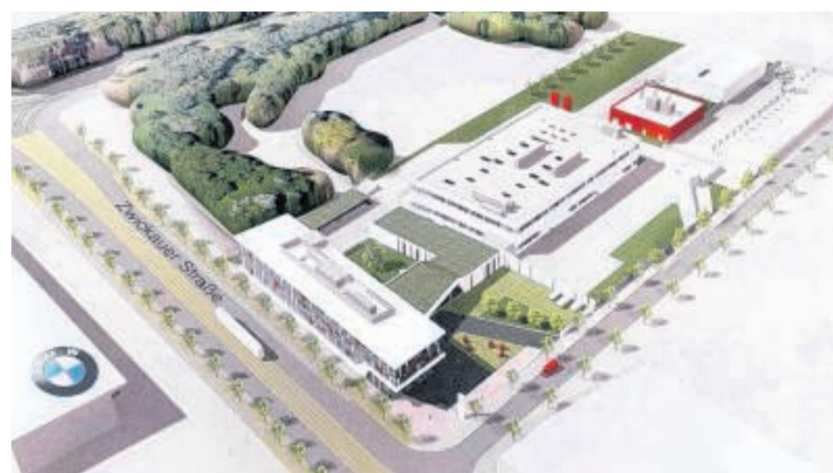
Das Haema-Areal umfasst genau die Hälfte der Fläche zwischen der Eggebrechtstraße (rechts) und der Richard-Lehmann-Straße (links oben). Grafik: LVZ-Redaktionstechnik