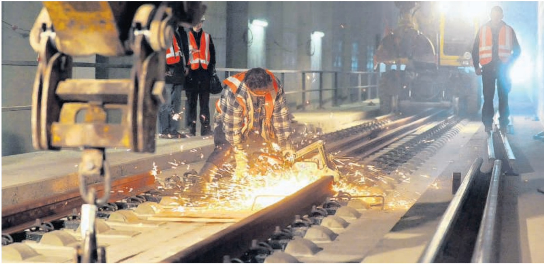
Bau-Etappe vollendet: In der Weströhre des Leipziger City-Tunnels sind gestern die letzten Schienen verlegt worden. Die bis zu 120 Meter langen Gleisstränge wurden in der unterirdischen Station Bayerischer Bahnhof und der angrenzenden Südrampe montiert. Die Ost-röhre ist bereits komplett mit Schienen ausgestattet. ► Seite 17