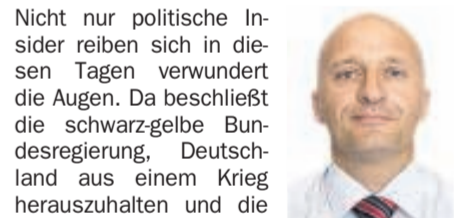
Von André Böhmer